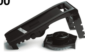
1 & 2