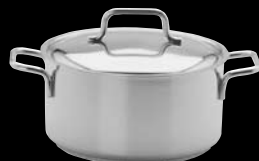
Kastruller och grytor